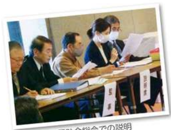
互助会総会での説明