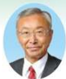
江田島市長 あきおか しゅうぞく 明岳 周作