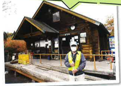
真道山森林公園管理