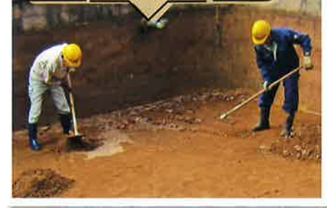
水源池砂削り作業