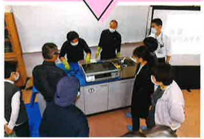
県連合主催 楽・ぴか・クリーンセミナー