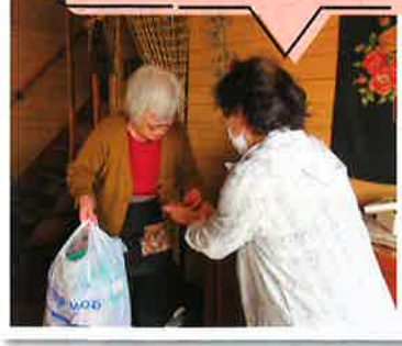
生活援助サポート事業 (ゴミ出し)