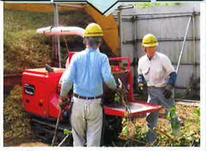
チップリサイクル作業