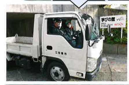
ゴミ収集車運転業務