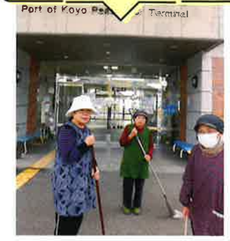
小用棧橋清掃作業