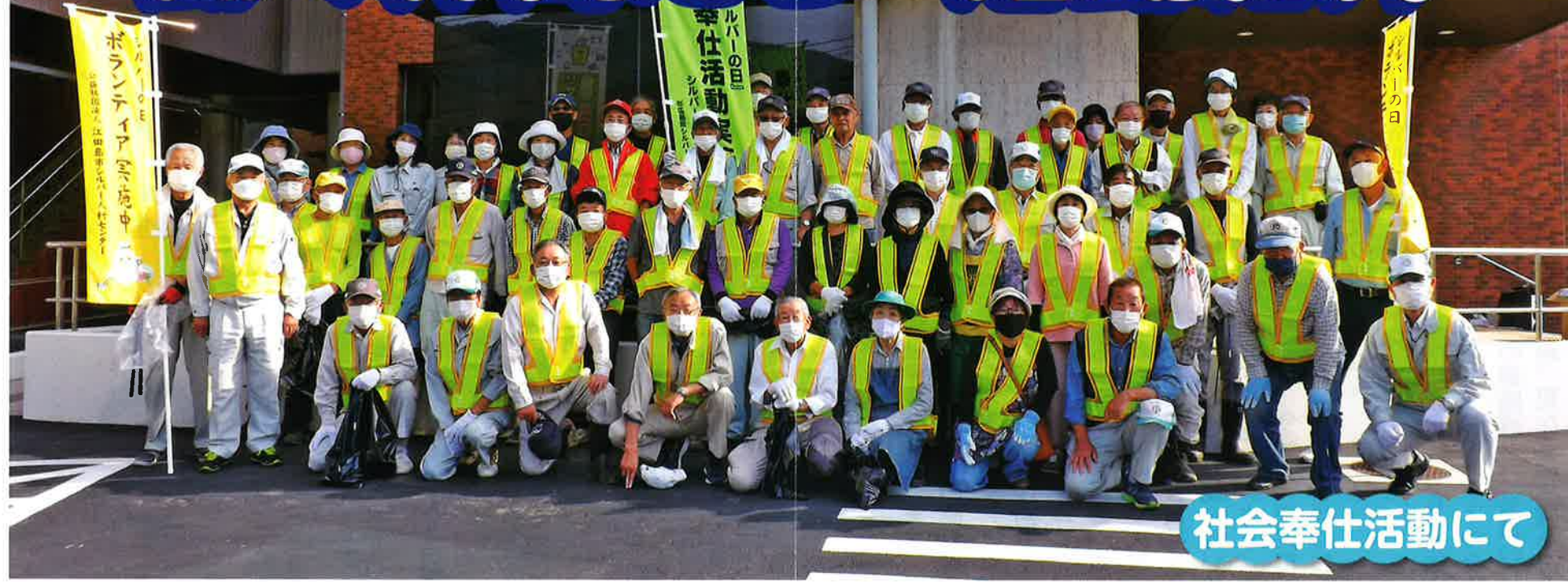
社会奉仕活動にて