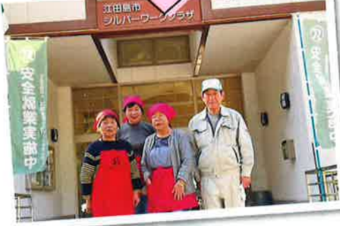
ふるさと納税チーム