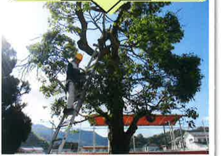
大古小学校剪定作業