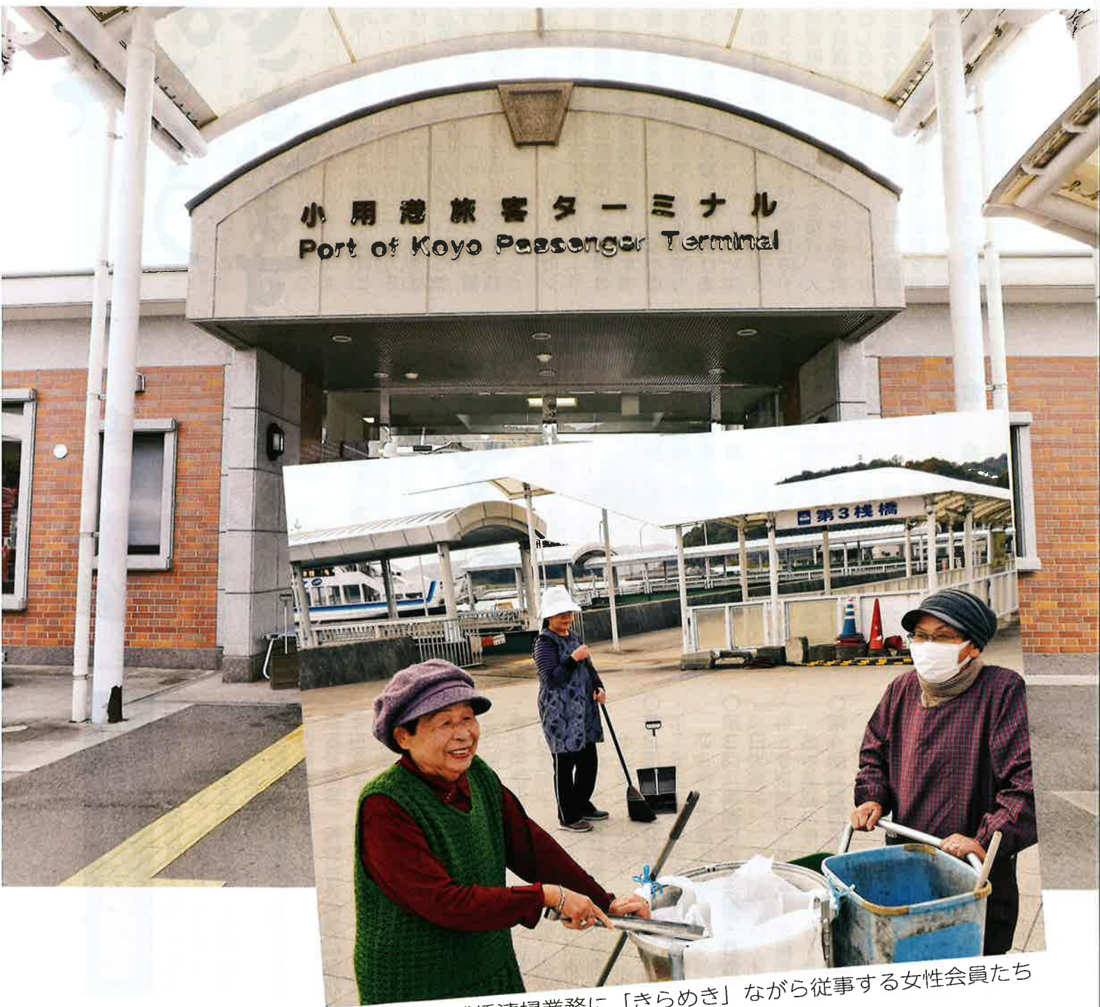
小用桟橋清掃業務に「きらめき」ながら従事する女性会員たち

「きらめき」の意味は、輝く瀬戸内海に浮かぶ美しい江田島で、活気にあふれ、互いに助け合い、しかも自分の持ち味を生かして「きらめき」ながら希望に満ちた有意義な人生を送るシルバー会員のイメージです。