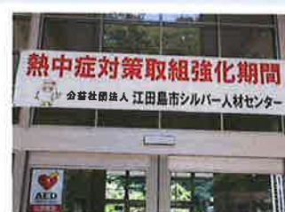
(本所正面玄関の横断幕)